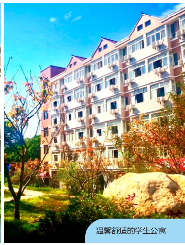
温馨舒适的学生公寓