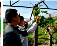
园艺果蔬嫁接实训