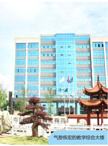
气势恢宏的教学综合大楼