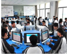
计算机应用理实一体化教学