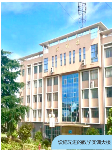
设施先进的教学实训大楼