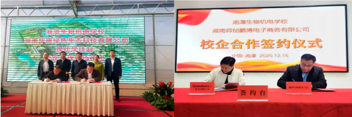
我校与湖南华银绿色生态科技有限公司、湖南师创鹏博公司校企合作签约仪式