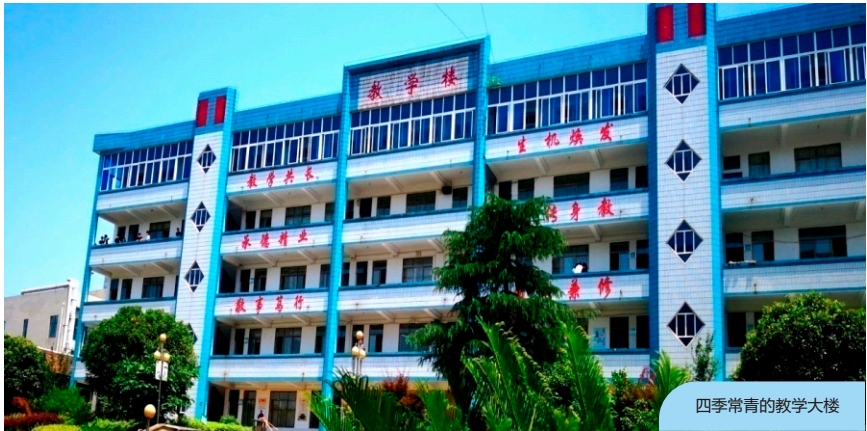
四季常青的教学大楼