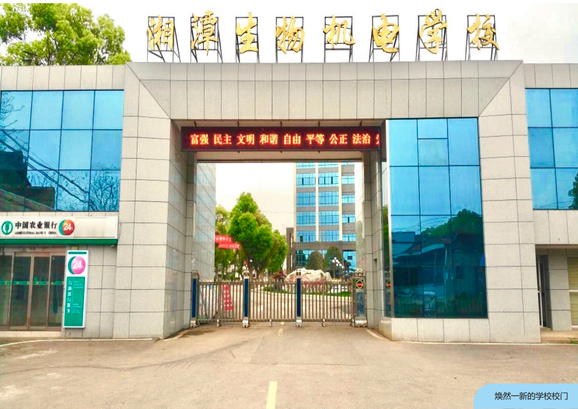
焕然一新的学校校门