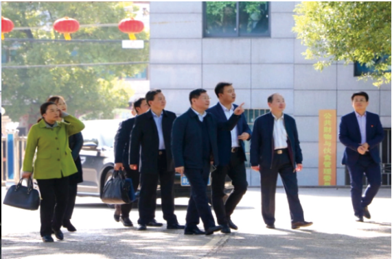
湘潭市人民政府副市长傅军同志来我校调研指导工作