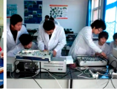
医疗器械维护与营销现场实训