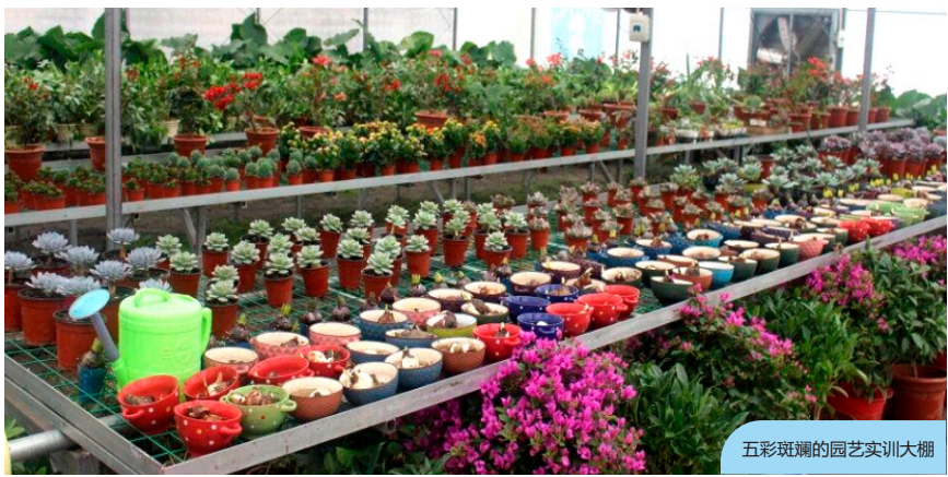
五彩斑斓的园艺实训大棚