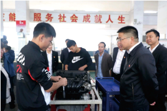
湘潭市委常委、纪委书记，市监察委员会主任胡卫兵同志来我校调研指导工作

级示范专业，畜牧兽医为省级示范特色专业，机电技术应用、计算机应用、农业机械使用与维护为市级示范特色专业；实训条件完善，有省级重点现代农艺校企合作生产性实习实训基地等教学仪器设备价值3627.3万元、工位数1520个的实训设备和场所。学校始终秉承“从严、立远、创新、奋进”的奋斗精神，坚持学历教育与技能培养并举，职业道德与职业能力并重的培养模式，对学生成长负责，为学生发展奠基。