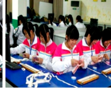
会计理实一体教学