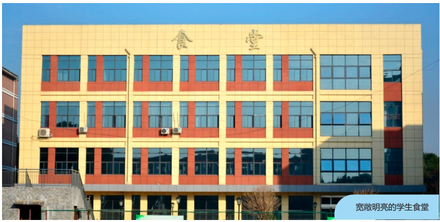
宽敞明亮的学生食堂