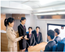
城市轨道交通实训

创新发展的培养理念：摒弃传统的教学模式，引入先进的职教理念，植入创新意识培养，学生在“学中做，做中学”，让知识学习不再乏味，让技能训练不再枯燥，毕业即可就业，毕业亦可创业。