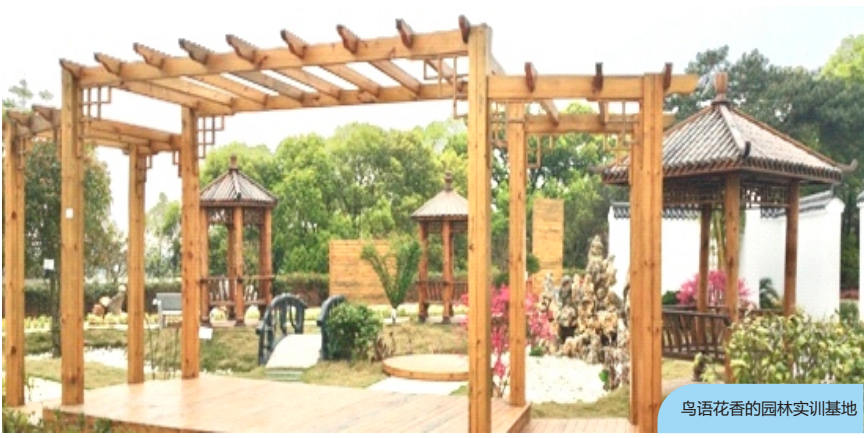
鸟语花香的园林实训基地