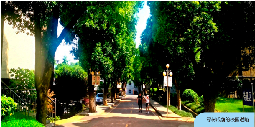
绿树成荫的校园道路